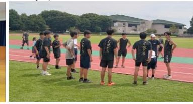
地域クラブ活動実証事業の様子

問合せ先：小美玉市教育委員会事務局 教育指導課 TEL:0299-48-1111 内線2232