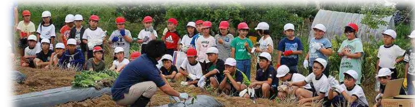
JAの皆さんがマルチをはり、苗を用意し、植え方を教えてくれました。