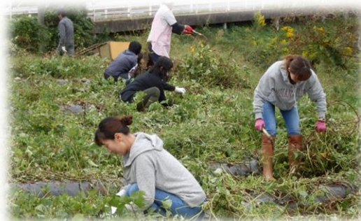
PTA奉仕作業でつる切りをおこないました