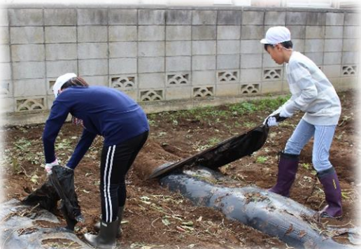
事前に6年生がマルチをはがしました。