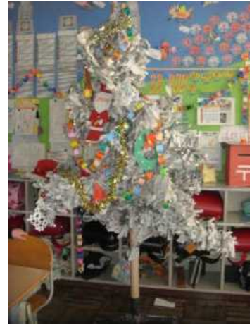
5年教室に飾られた 見事な手作りリツリー