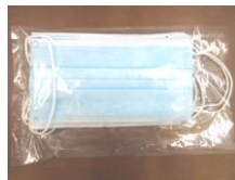
市から一人10枚マスクを配付 (5/11, 12)