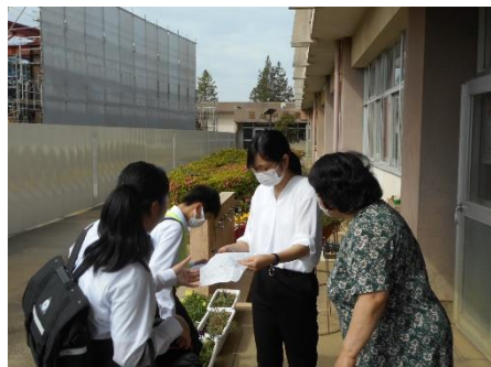
健康観察カードのチェック