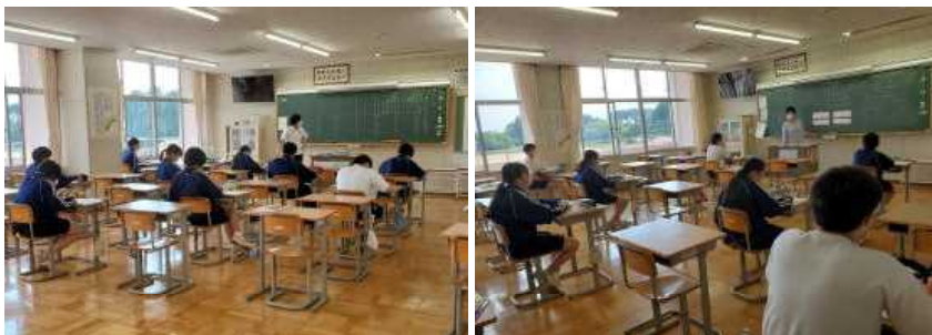
分散登校でちょっと寂しい教室

長い臨時休業期間を終え、やっと学校に子どもたちの声が戻ってきました。6月最初の1週間は分散登校ではありますが、久しぶりの友達との再会は、生徒たちも嬉しかったようです。8日からは、通常どおりの授業となります。3年生、いよいよ本格スタートとなります。卒業まで共に過ごしていく仲間と、かけがえのない時間を大切に学級づくり、そして学年づくりをしていきたいと思えます。また、8日からは、部活動も再開されます。目標としていた総体は中止となってしまいましたが、活動は7月末まで（最長8/2）となっています。新たに入ってくる1年生に、ひたむきに部活動に取り組む姿、最後まで諦めずにチャレンジし、やり抜く精神など、伝えるべきたくさんあることをしっかりと伝えていってほしいと思っています。