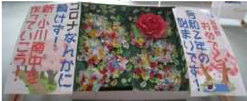
～生徒ホールで生徒達を迎えるメッセージ～

長い臨時休業期間を終え、やっと学校に子どもたちの声が戻ってきました。6月最初の1週間は分散登校ではありますが、久しぶりの友達との再会は、生徒たちも嬉しかったようです。8日からは、通常どおりの授業となります。3年生、いよいよ本格スタートとなります。卒業まで共に過ごしていく仲間と、かけがえのない時間を大切に学級づくり、そして学年づくりをしていきたいと思えます。また、8日からは、部活動も再開されます。目標としていた総体は中止となってしまいましたが、活動は7月末まで（最長8/2）となっています。新たに入ってくる1年生に、ひたむきに部活動に取り組む姿、最後まで諦めずにチャレンジし、やり抜く精神など、伝えるべきたくさんあることをしっかりと伝えていってほしいと思っています。