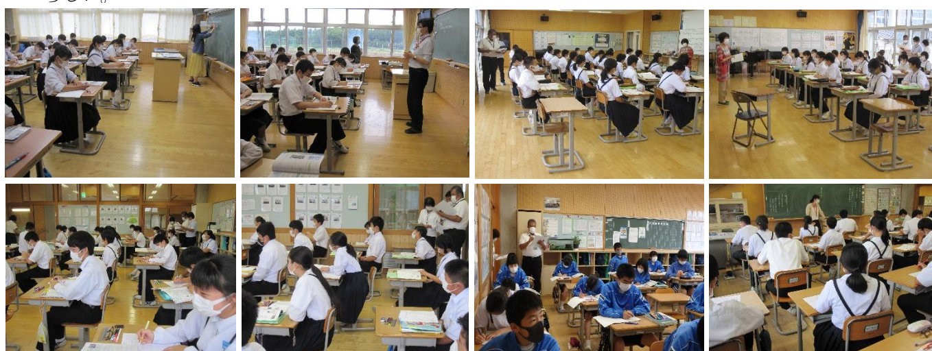
訪問時の授業の様子。どの学級も落ち着いて学習に臨んでいました。取り組んできたOKスタイルの学習も現在は“自粛”です。