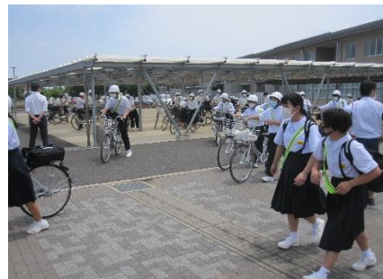
学年総出の下校指導。挨拶がよくできて気持ちがいいのは北中の伝統です。