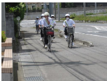
午後の登校は13時前の暑いなか。皆口をそろえて「午前登校がいい！」