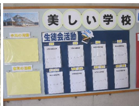
校内は花壇や掲示物も休校中に着々と準備。委員会の掲示も準備万端です。