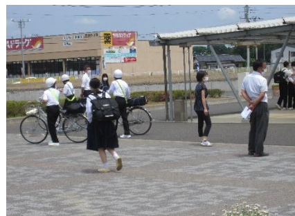
元気に帰るのも明日につながるいい姿。ちょっと軽やかな足取りを感じます。