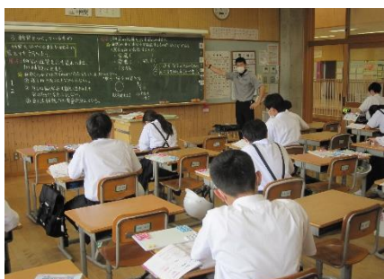
熊澤先生の理科は、「物質をつくっているもの」の学習。集中力を感じました。