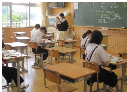
星先生の社会は、韓国併合など歴史の学習。3年生は特に集中力を感じますね。