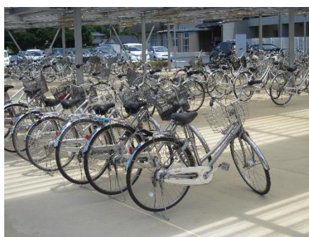
自転車置き場も入れ替わって半数ずつの分散登校。来週からはフル活用です。