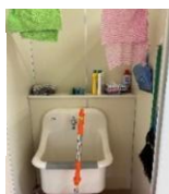
清掃用具入れも整理・整とん