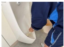
小便器のカバーをずらしてみがく