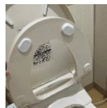
便器の中も便座の裏側もピカピカに