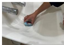
手洗い場の排水口の金具を少し持ち上げて、みがく